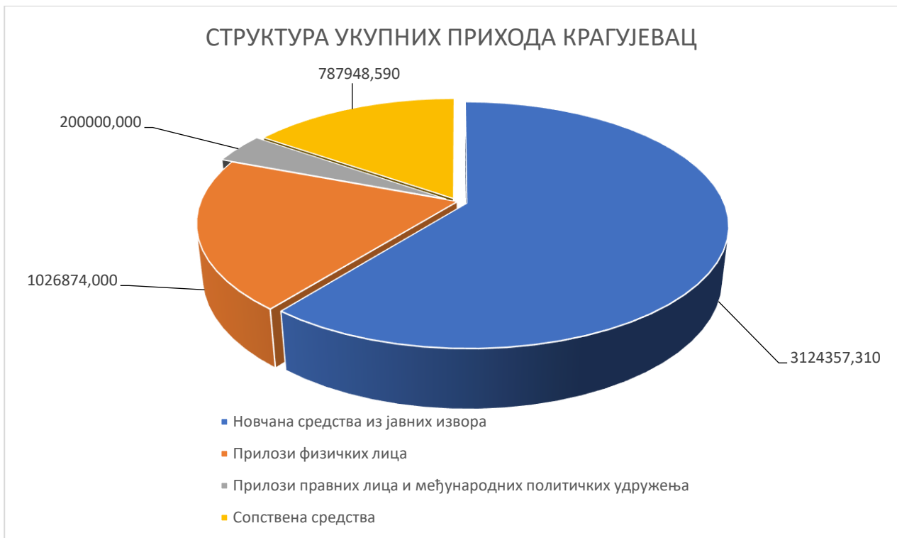
Графикон 2: Структура укупних прихода политичких субјеката у процентима за град Крагујевац