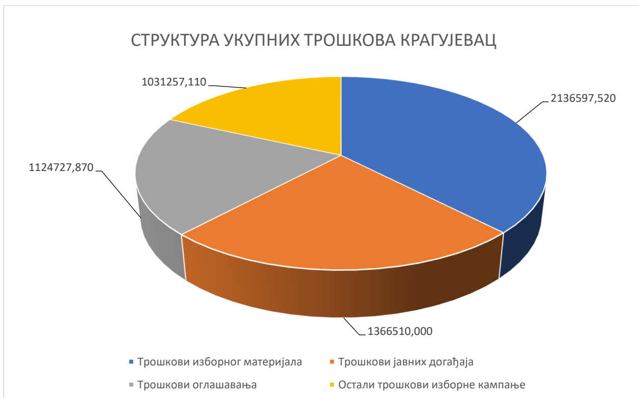
Графикон 4: Структура укупних трошкова политичких субјеката по врстама за град Београд