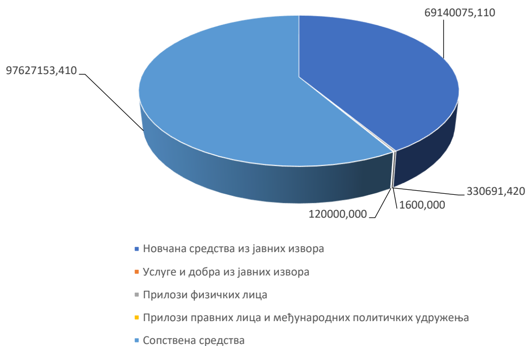
Графикон 1: Структура укупних прихода политичких субјеката у процентима за град Београд